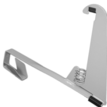
Beispiel: Schneefanggitterstütze zum Einhängen, verzinkt